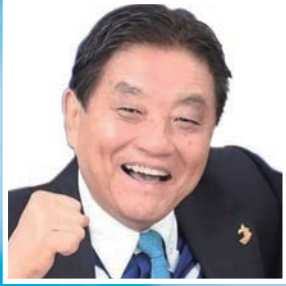
共同代表 河村たかし (名古屋市長)

日本がいま内外から壊されようとしています。 愛する日本を守りたい、 私たちはそのために立ち上がりました！