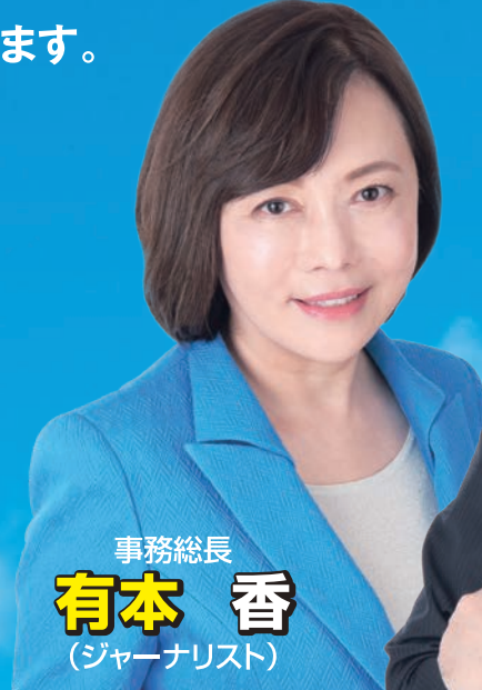
事務総長 有本 香 (ジャーナリスト)