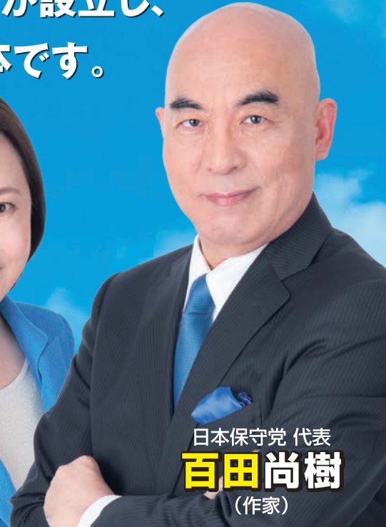
日本保守党 代表 百田尚樹 (作家)